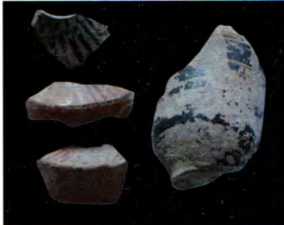
Athena Tapınağı temel dolgusu buluntuları.

benzerlik göstermektedir. Etrafı "L" planlı bir stoa ile çevrelenen kutsal alanda, kuzey stoan ın doğu stoa ile birleştiği noktada kalp formulu köşe sütun tamburları yer almaktadır. Dor düzenindeki stoaların iç kısmında İon sütun sırası uzanıyor olmalıdır. Duvar örgüsü, geison ve sütun stilleri açısından Atina'daki II. Attalos Stoası 'yla benzerlikler görülmektedir. Bu alanın, MÖ 156-154 tarihinde gerçekleşen II. Prusias tahribatı sonrasında gerçekleşen imar faaliyetleri sırasında son şeklini almış olduğu düşünülmüyor.