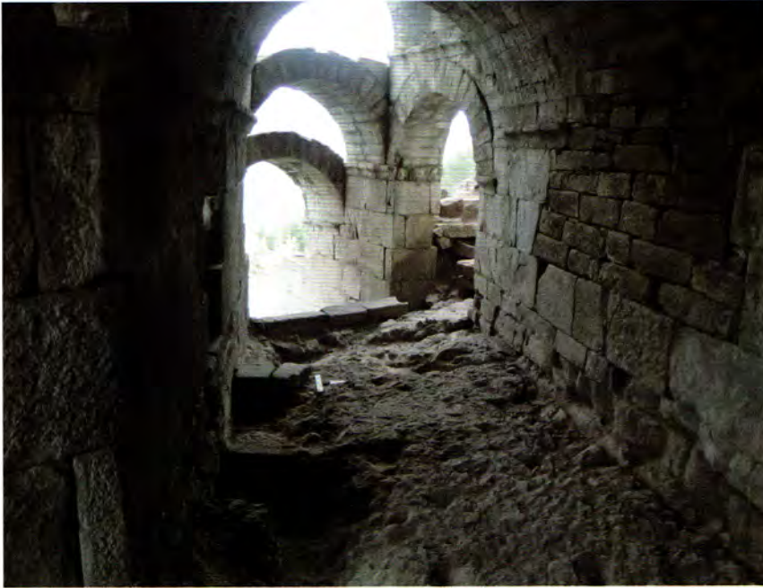
Vomitorium'dan dışarıya bakış.