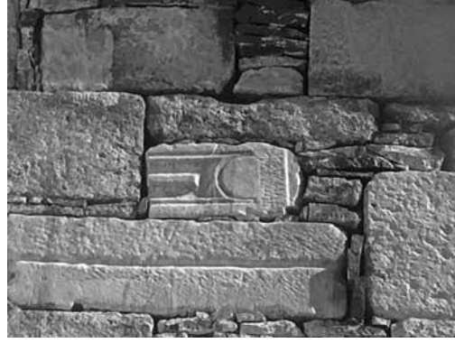
Res. 10a-b-c-d: Karaahmetli Camii

oldukça tahrip olmuş ve çok az bir kısmı okunabilmekte olan mezar taşlarıdır (Griffiths 1805: 256). Richard Chandler ise Philadelphia'dan ayrılıp Sardeis için yola çıktıklarında bir çeşmede mola verdiklerini ve burada Batı Anadolu birçok yerde karşılaşmış olduğumuz antik malzemelerin çeşme yapımında kullanılmasına bir örnek vermektedir. Gördüğü bu çeşmenin yalağının devşirme malzeme ile ürettiğini üzerinde Antik Yunanca yazıtlar ve girlandlarla süslü mermerden bir lahit olduğunu öğrenmekteyiz (Chandler 1817: 290). Manisa'ya ayrıntılı bir gezi gerçekleştiren Charles Boileau Elliot, Philadelphia'daki mezarlıkta karşılaşmış olduğu antik sütunların ve Yunanca yazıtların mezar taşı olarak kullanılmasından söz etmektedir (Elliot 1838: 84).