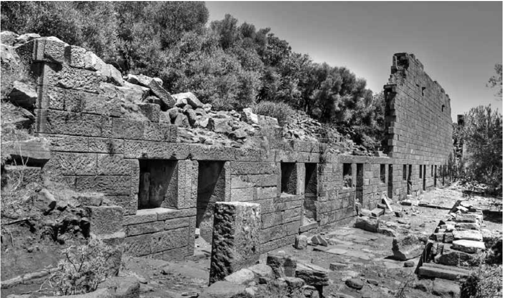
Res. 6: Aigai Agora Binası.

Lahitler yalnızca su yalağı olarak değil farklı işlevler için de tercih edilmiştir. Tahıl öğütme, zeytin ezme gibi günlük yaşama ilişkin işlevler bunların başında gelmektedir. Buna pekmez yapımını da eklemek mümkündür. Davis 1800'lerde Anadolu'ya geldiğinde köylülerin Bizans lahitlerini pekmez yapımında kullandıklarını görmüştür (Davis 2006: 59). Lahit kapakları zeytinyağı üretimi için kullanıldığı gibi kimi zaman da içinde ateş yakmak için kullanılmıştır. Diğer taraftan zeytinyağı değirmenleri ve şarap presleri en sıklıkla tekrar kullanım gören malzemelerin başında gelmektedirler. Ezme taşları her iki ürünün üretimi için farklı dönemlerde tercih görmüştür. Bazı durumlarda ise zeytinyağı presleri gerçek işlevinden bambaşka bir biçimde kullanılmıştır. Öyle ki preslerin ve pres ağırlıklarının duvarlarda yapı malzemesi olarak dahi iş gördüğü anlaşılmaktadır (Şahin 2008: 123).