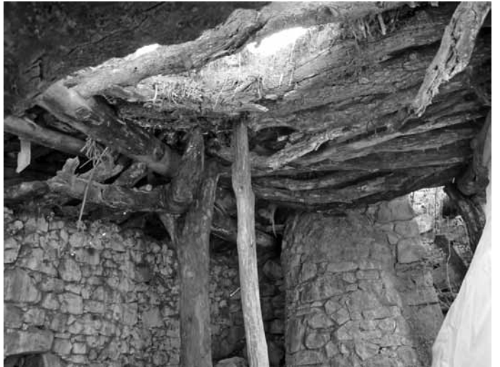
Res. 14: Aigai Yakınlarındaki İkinci Değirmen