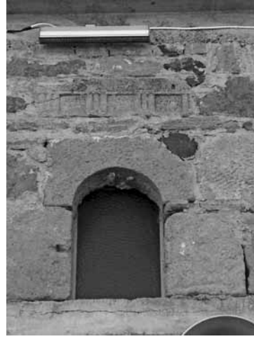
Res. 7a-b: Köseler Cami

Tahılları öğütmek için antik malzemelerin dibek olarak kullanılması da karşılaşılan bir uygulamadır. Hamilton, Anadolu'ya geldiğinde Antoninus Pius'un oğlunun onuruna yaptırılmış heykelin dairesel kaidesinin oyulup buğday öğütmek için bir dibeğe dönüştürüldüğünü aktarmaktadır (Hamilton 1842: 309). Eski gezginler, toprak kayması önlenmek için antik döneme ait sütunların kullanıldığını aktarmaktadır (Pınar 1994: 68).