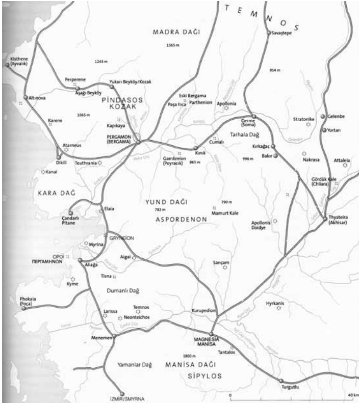
Res. 1: Yunt Dağı Haritası (Radt 2002, s. 17, R. 4).

En yaygın uygulama kuşkusuz devşirme malzemenin aynı antik kentte daha geç bir dönemde farklı bir yapıda mimari malzeme olarak kullanımına yöneliktir. Antik kentlerde erken dönem sur duvarlarında kullanılan taşlar geç dönem savunma sistemi içerisinde kullanıldığı, gibi yerleşimdeki erken dönemlere tarihlenen farklı yapılardan alınan taşlar da geç dönem yapıları için bir kolaylık anlamına gelmektedir.