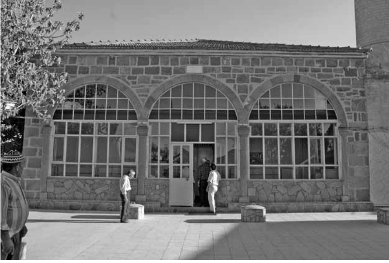
Res.11: Siyekli Camii.

camisine götürüldüğü belirlenmiştir (Res. 11). Siyekli Köyü'nün yaşlıları ile yapılan görüşmelerde, 1953 yılında yapılan caminin taşlarının, tiyatronun üstündeki alandan taşındığı ifade edilmiştir. Caminin duvarlarında kullanılan büyük dörtgen bloklar ve özellikle caminin giriş bölümünde görülen yüksek sütunları bir bakışta Athena Tapınağı'nın sütunları ile ilişkilendirmek mümkündür.