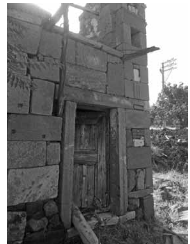
Res. 9a-b: Karaahmetli Konak.