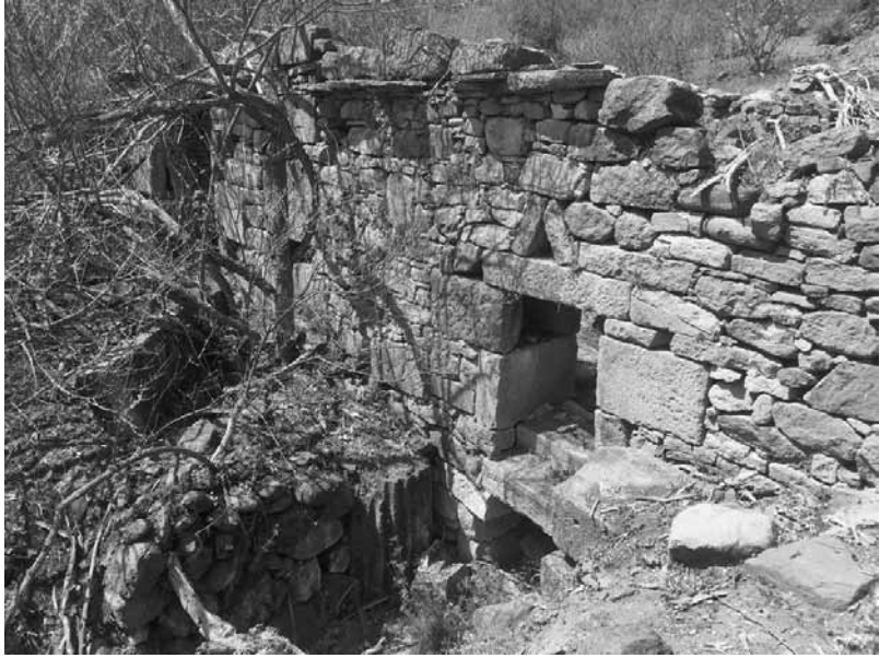
Res. 13a-b: Apollon Tapınağı'ndan alınan taşlarla yapılmış değirmen