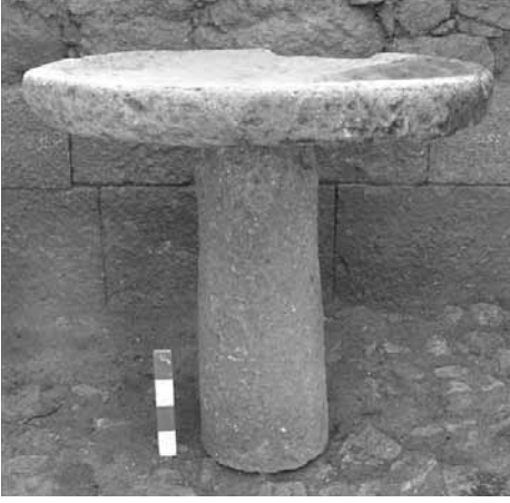
Res. 3: Aigai taş perrihanterion.

taş tedarik edildiğini de göstermektedir. Bu noktada özellikle bazı yapıların farklı mimari unsurlarının inşasında ve dekore edilmesinde özel yapılardan taşların kullanılmasının amaçlandığı ve eski görkemli yapıların malzemesinin özellikle tercih edilmiş olduğu görülmektedir. Yapı ne kadar ihtişamlı ise birçok örnek mimari parçalarının o kadar uzak mesafeler kat ederek taşınabileceğini ve yeni mimarilerde kullanılabileceğini göstermektedir. Bu konudaki en bilinen örnek kuşkusuz Ayasofya'dır. Ayasofya'nın inşa edilmesini içeren anlatıda Bizans kralı Justinianus gördüğü rüyası neticesinde yedi diyarın krallardan Aya Sofya'yı inşa etmesine katkıda bulunmaları için Hindistan, Arabistan, Yemen, Maghrib, İran, Çin, Türkistan, Bizans ve Avrupa'daki pagan tapınaklarından alınmış nadir taşlar göndermelerini buyurur (Necipoğlu 1992: 199-200).