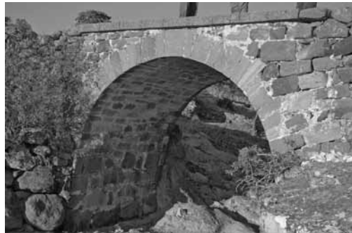
Res.12a,b: Siyekli Köprüsü, a-köy dışı, b-köy içi.