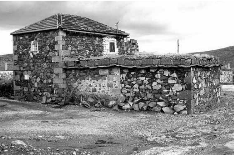
Res. 8: Köseler Köyü (Aigai Kazı Arşivi)

Ancak şunu belirtmemiz gerekir ki şipolyen, kelime anlamı olarak her zaman olumsuz anlamlara çağrışım yapmamaktadır. Eski eserin tekrar kullanımı, dolayısıyla bazı durumlarda günümüze taşınabilirliği, farklı bir bakışı da ortaya koymaktadır. Örneğin, Anadolu Selçukluları dönemine ait sur duvarlarında farklı dönemlere tarihlenen mimari parçalar ve heykellerin süsleme elemanı olarak kullanmaları, sonrasında Osmanlı döneminde de bu geleneğin devam ettirilmesi Semavi Eyice tarafından koruyucu eski eser toplayıcılığının belirtisi olarak yorumlanmıştır (Eyice 1978: 3-4). Bununla birlikte bazı örneklerin eski eser kaçakçılarının elini yavaşlattığını dahi söylemek mümkündür. 9