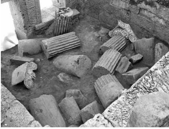
Res. 5: Aigai taş perrihanterion (Aigai Kazı Arşivi).

Constantin von Tischendorf, bu küçük köyün evlerinin Ephesos'tan gelen mermer parçalarıyla inşa edildiğine değinmektedir (Tischendorf 2010: 257).