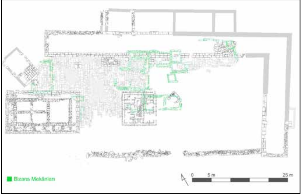
Çizim 1: Athena Kutsal Alanı planı.