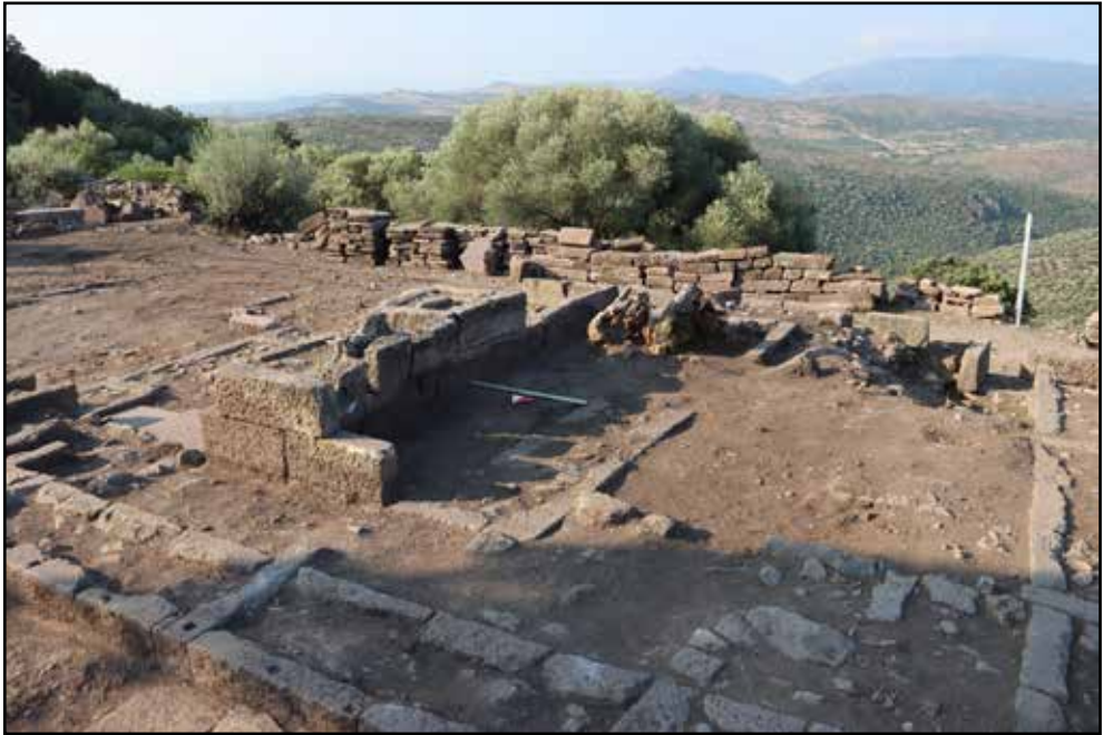
Resim 4: Athena Kutsal Alanı, Sunak temeli çalışma öncesi.