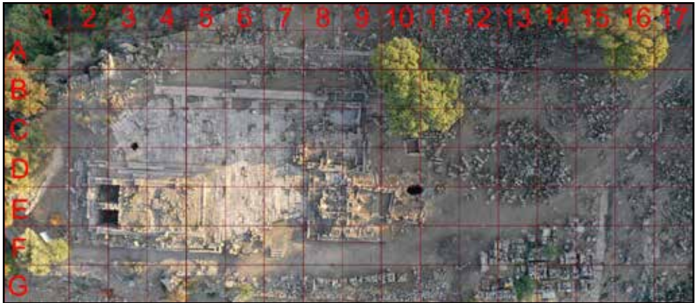
Resim 1: Athena Kutsal Alanı, kareleme sistemi.