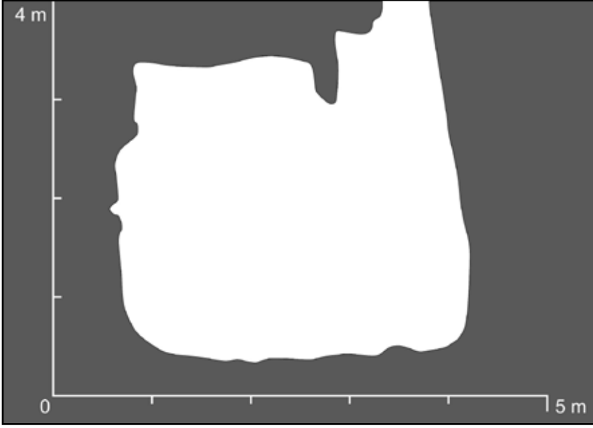
Çizim 3: 9 No.lu Sarnıç, kuzey-güney doğrultusu kesit çizimi.