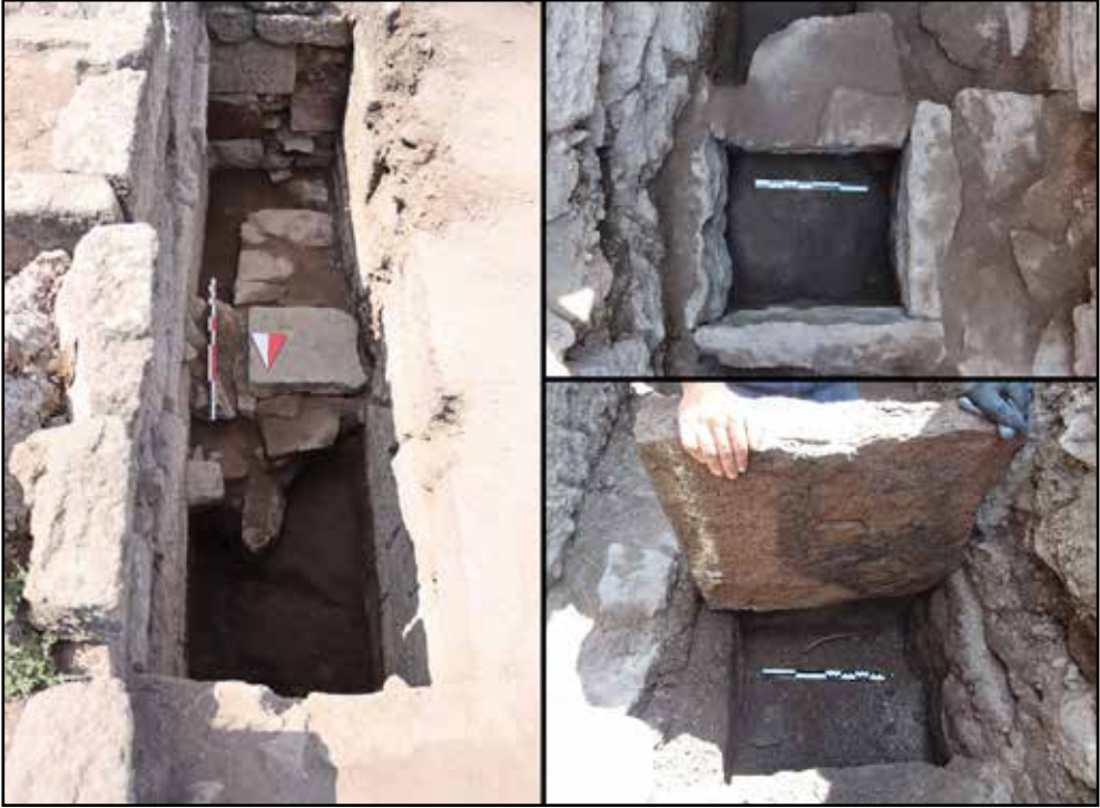
Resim 5: Sunak podyum temeli, sunu çukuru.