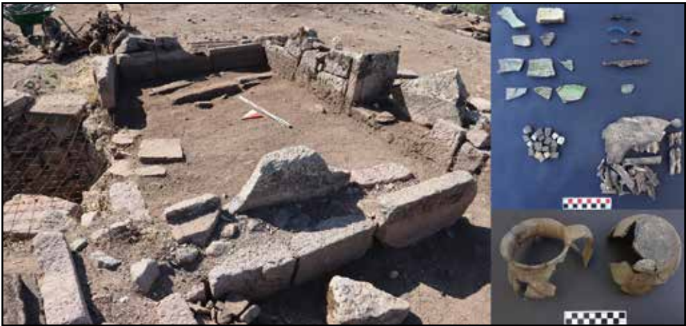
Resim 2: 9 No.lu Bizans Mekanı ve taban buluntuları.