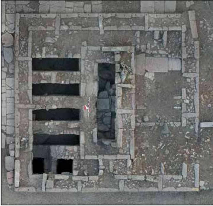
Resim 9: Athena Kutsal Alanı, Sunak yapısı.