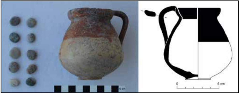
Resim 6: Podyum temeli, sunu çukurunda bulunan sunu kabı ve taş pullar.