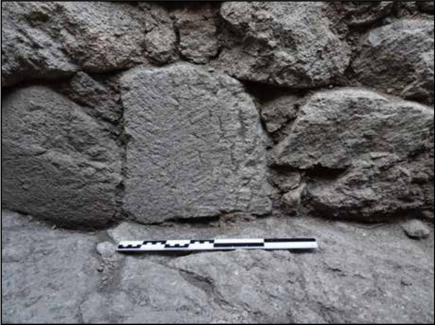
Resim 8: Sunak, Batı Krepidoma Temeli 3'teki duvar taşı (Lydce yazıt parçası?).