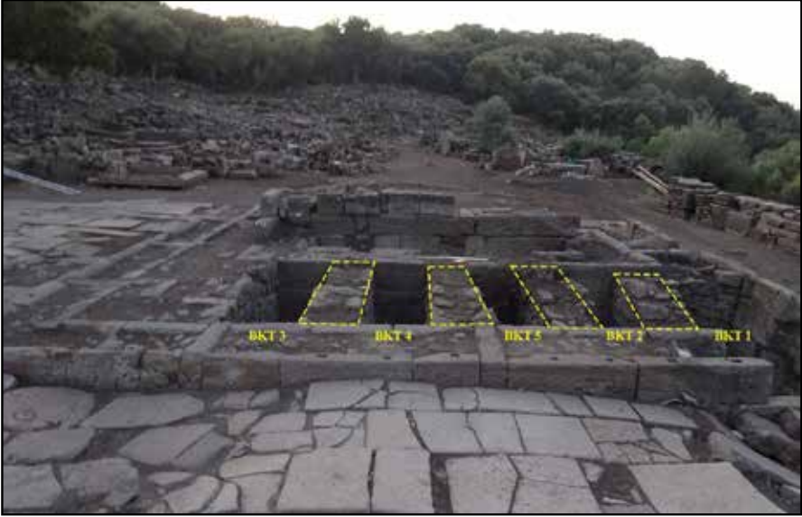
Resim 7: Sunak, Batı Krepidoma Temeli ve atkı duvarları.