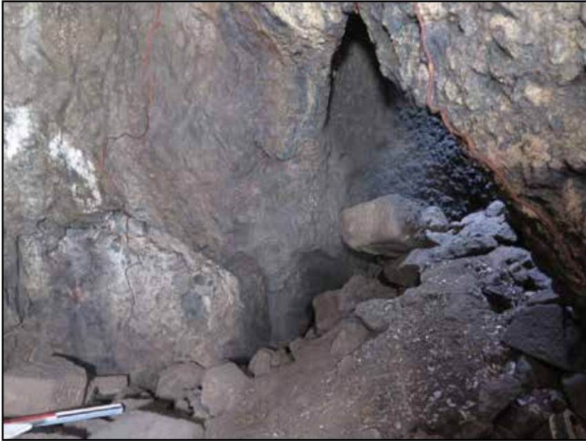
Resim 11: 9 No.lu Sarnıç, hazne bölümüne geçişi sağlayan ana kayaya oyulmuş kemer.