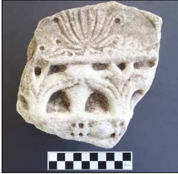
Resim 3: 10 No.lu Bizans Mekânı duvar dolgusunda bulunan bezemeli mimari blok parçası.