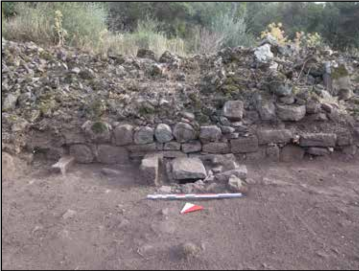
Resim 10: Athena Caddesi kenarında tespit edilen 9 No.lu Sarnıç.